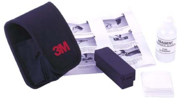
Kit de nettoyage pour fiche (mâle) VF45™

Ce système utilise un procédé de nettoyage mécanique, qui élimine tout débris et poussières de la face des fibres.