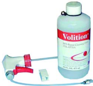
Kit de maintenance pour VF45™

Le liquide nettoyant Volition HFE possède des propriétés uniques. Les connexions VF45™ doivent être nettoyées uniquement avec ce liquide.